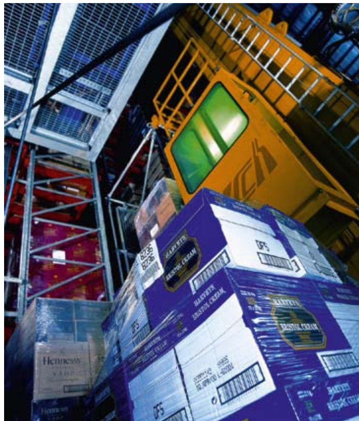
Le transfert des palettes vers le tapis transporteur s'effectue par grue dans l'installation ASRS de YCH.

Nous avons surtout procédé à un examen complet de la documentation, des procédures et des mesures physiques de sûreté déjà en place. Des entretiens ont été menés avec la direction de tous les départements ayant une interface avec la sûreté de la chaîne d'approvisionnement.