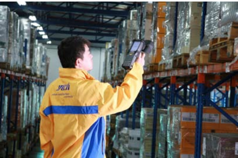
Un employé de YCH scanne les marchandises à l'aide d'un équipement de pointe RFID (Identification par radiofréquence).

L'objectif de cette première étape était de prouver que notre SMS était conforme à ISO 28000:2007, et d'identifier les lacunes appelant des ajustements pour assurer la conformité du système aux exigences de la norme.