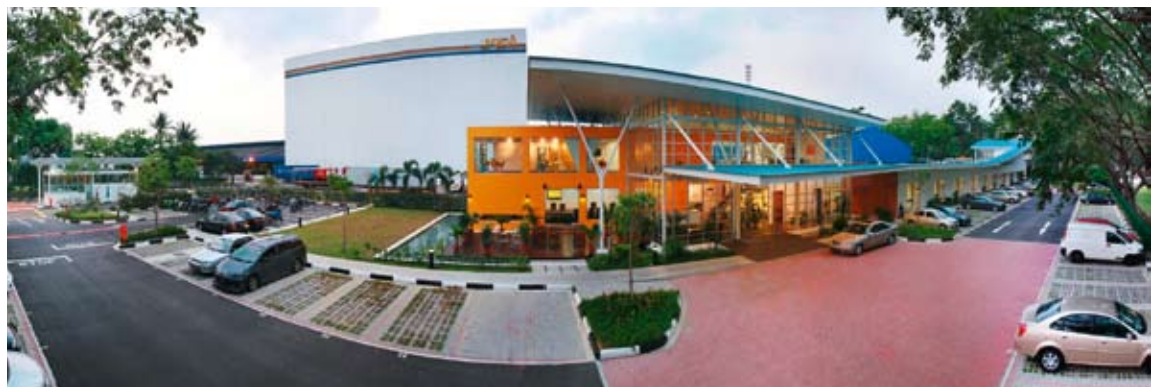
À Singapour, le siège du Groupe YCH, une entreprise de gestion de la chaîne d'approvisionnement certifiée ISO 28000:2007.