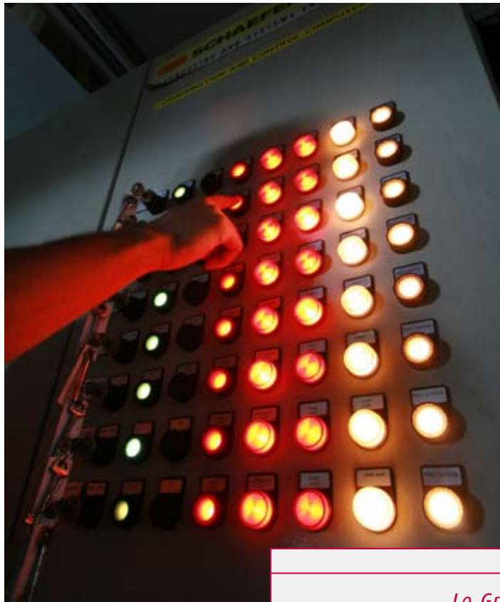
Le tableau de bord commandes/capteurs du système ASRS de YCH.

La norme propose une approche pragmatique, axée sur les