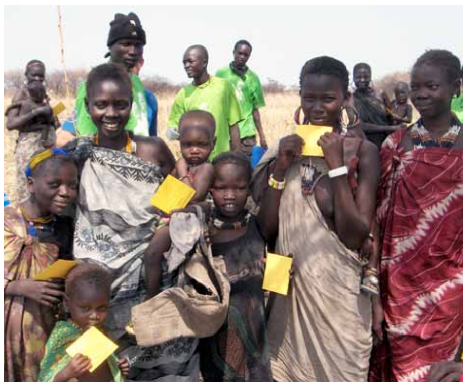
Enfants du Soudan du Sud avec leurs cartes de vaccination contre la rougeole.

Le financement de Medair provient en grande partie de donateurs institutionnels. Ils ont des exigences rigoureuses pour le rapport sur l'utilisation de leurs fonds, ce qui est dans l'ordre des choses. Nous avons observé une augmentation régulière du nombre d'audits