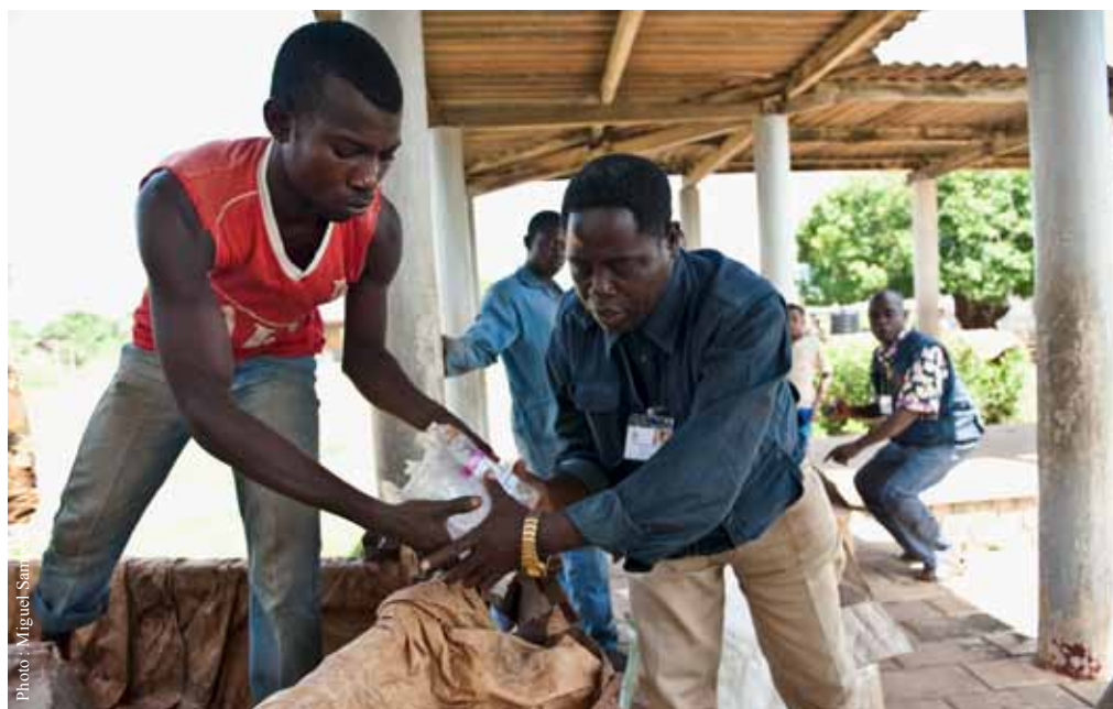
Distribution de trousseaux d'urgence lors d'une épidémie de dysenterie en République démocratique du Congo.

La qualité, c'est agir en fonction de normes et s'améliorer en continu. À Medair, nous