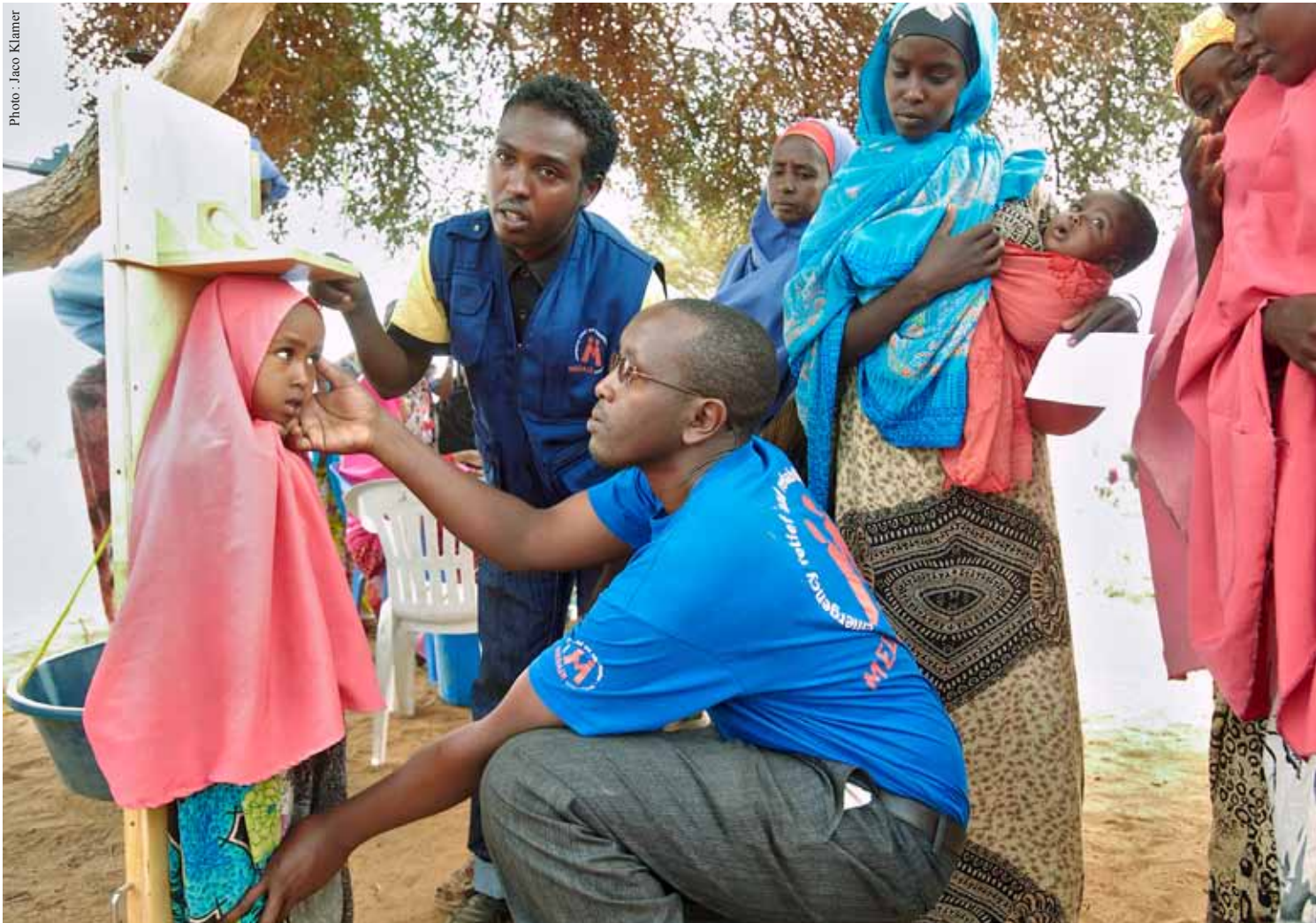
Évaluation nutritionnelle au Somaliland.

exigés à différents stades de nos projets. Dans le cadre de notre SMQ, des systèmes bien établis nous permettent de répondre à leurs exigences de rapport et de mettre en place des mécanismes pour le suivi des recommandations d'audit.