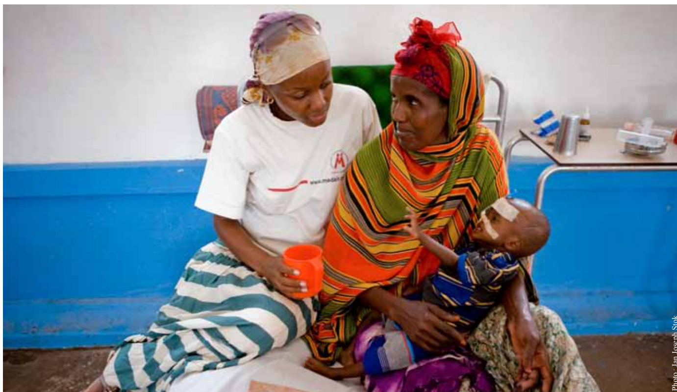
Une mère et son enfant dans une clinique Medair au Somaliland.