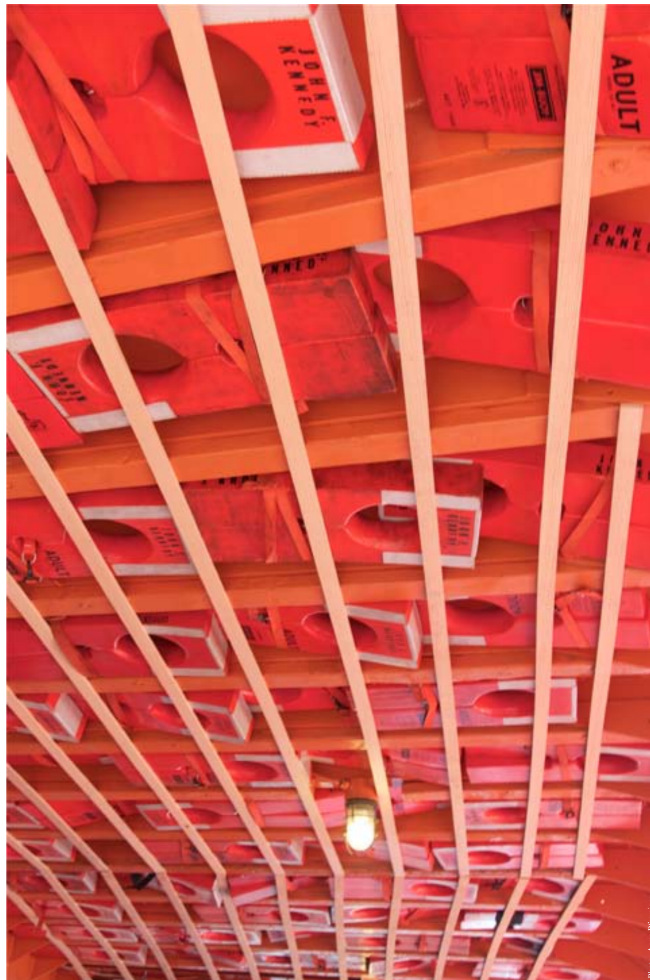
Gilets de sauvetage à bord du Staten Island Ferry, New York City.